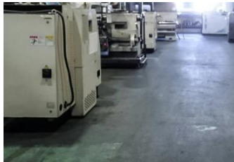
床の油汚れがひどくて 塗装できない