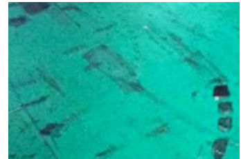
塗装してもすぐに 床が汚れる