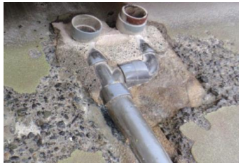
コンクリートが クラック・欠損している