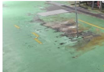
塗装しても油で すぐに剥がれた